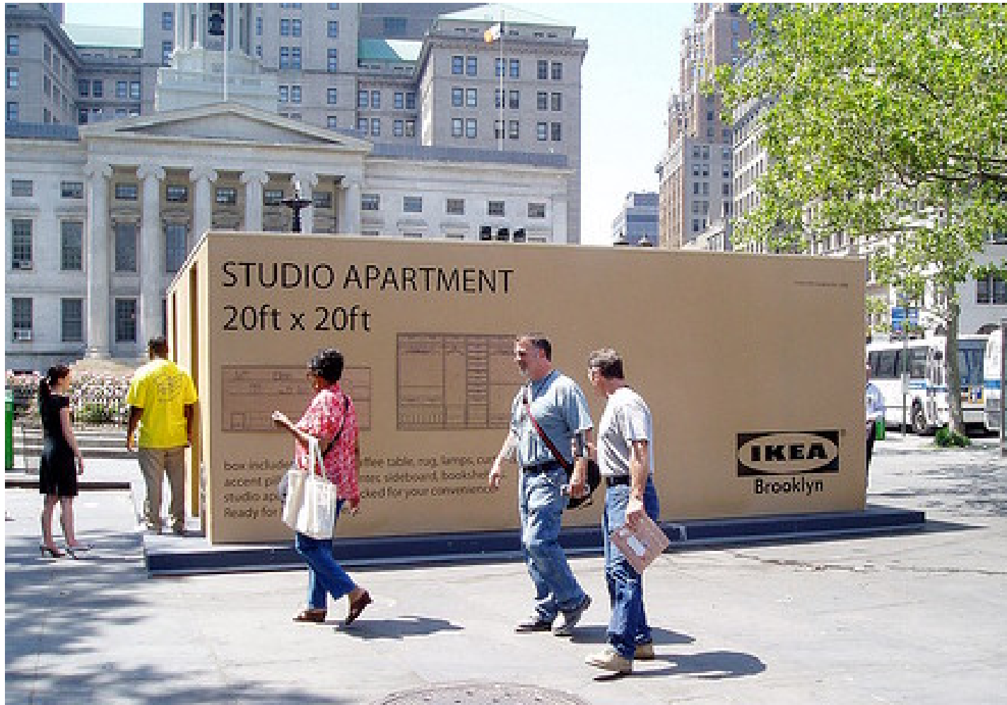
Ikea promotie actie