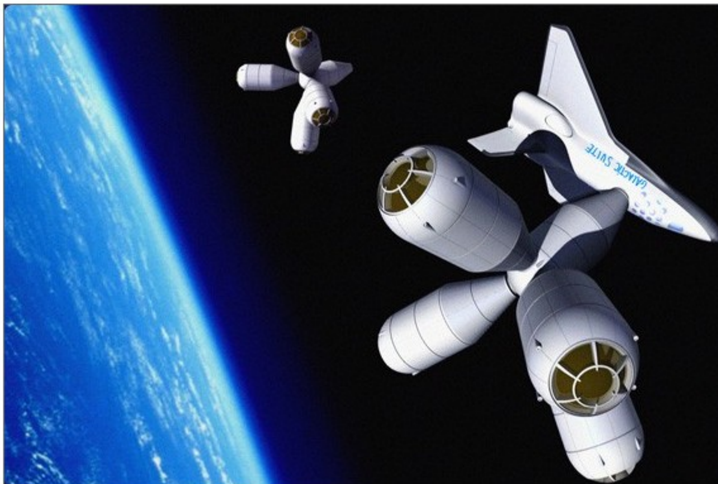
The Galactic Suite Space Resort door ruimtevaarttechnicus Xavier Claramunt (hotel)