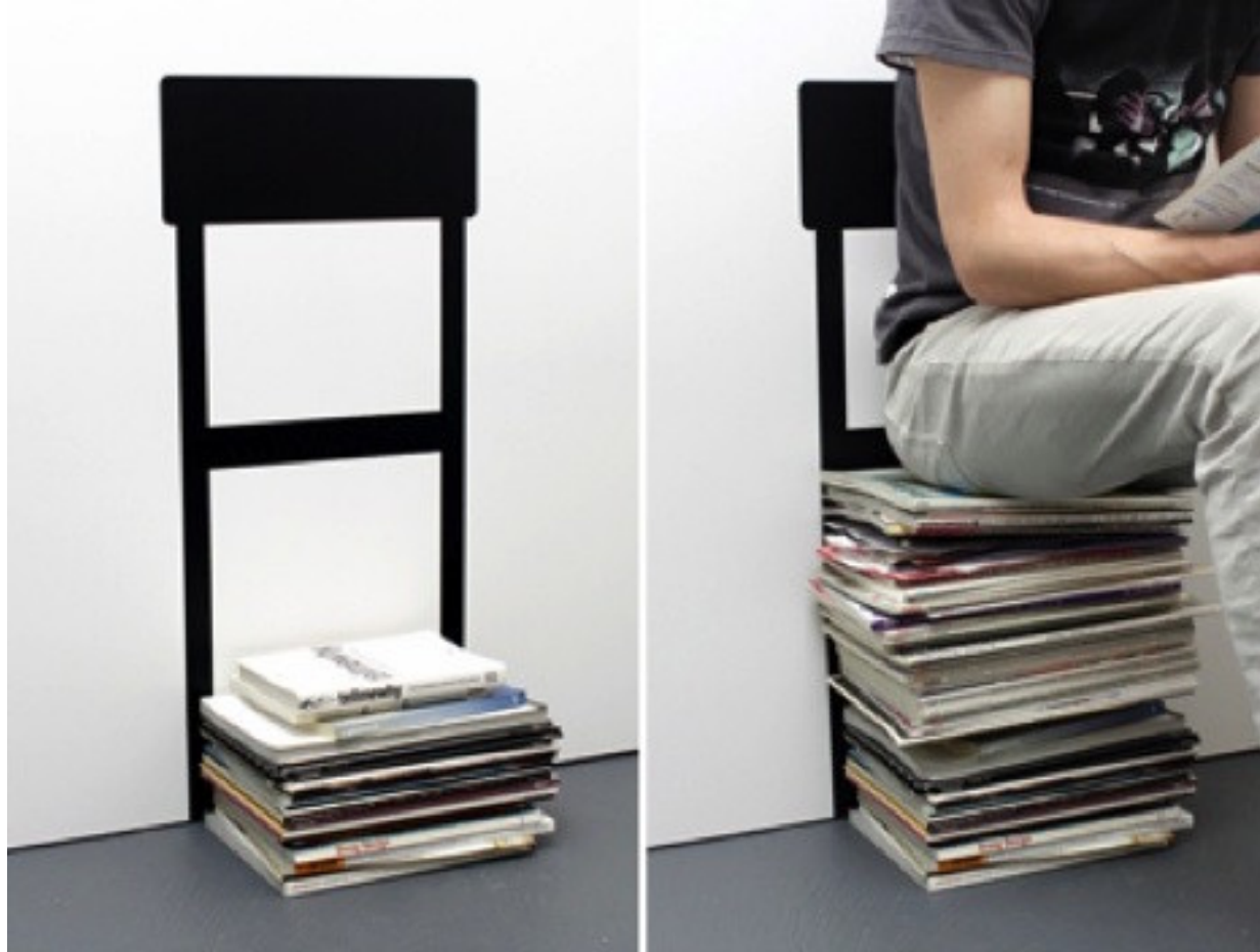
Stack Chair by Florian Kremb