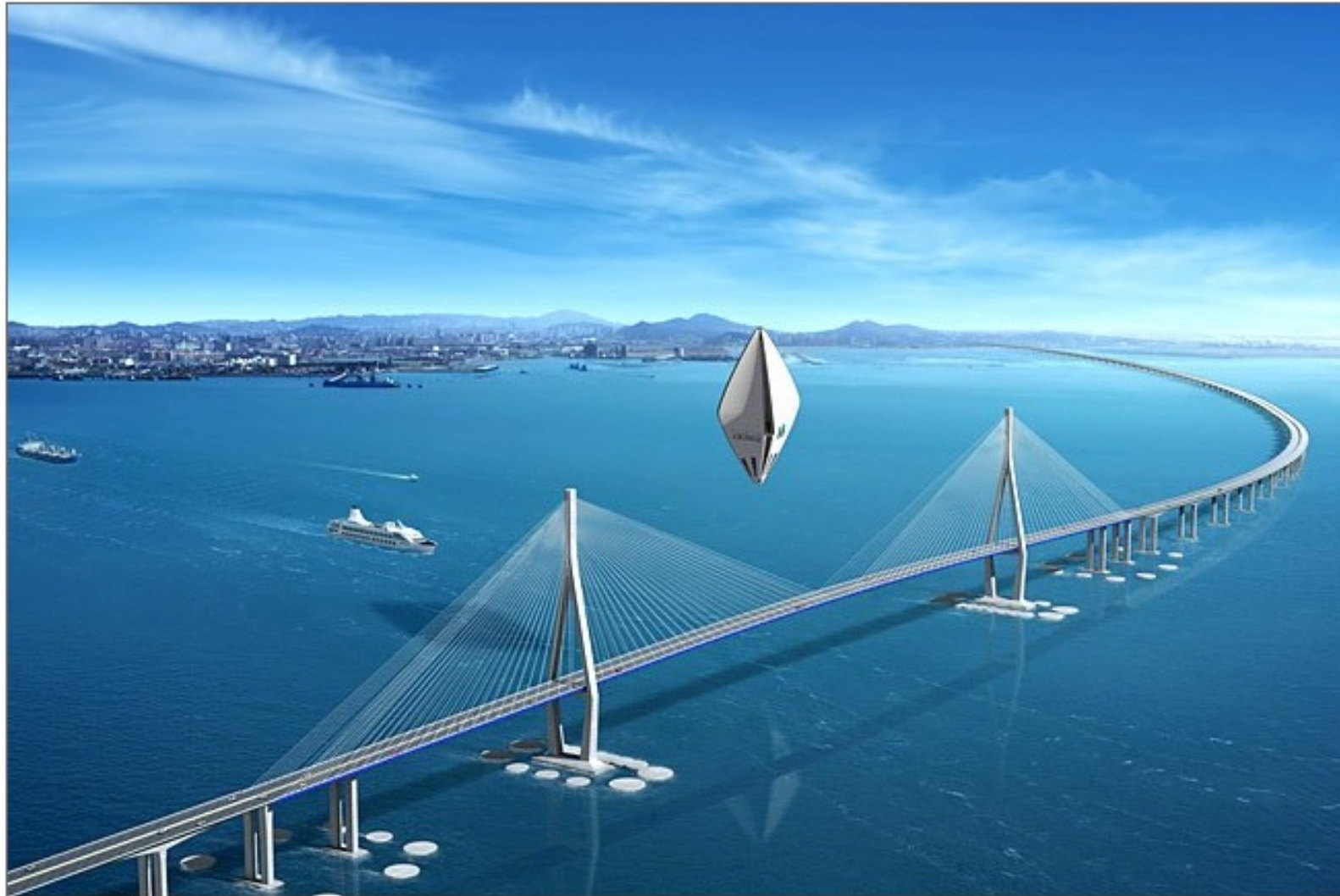
Seymourpowell Aircruise door ontwerper Nick Talbot (hotel)