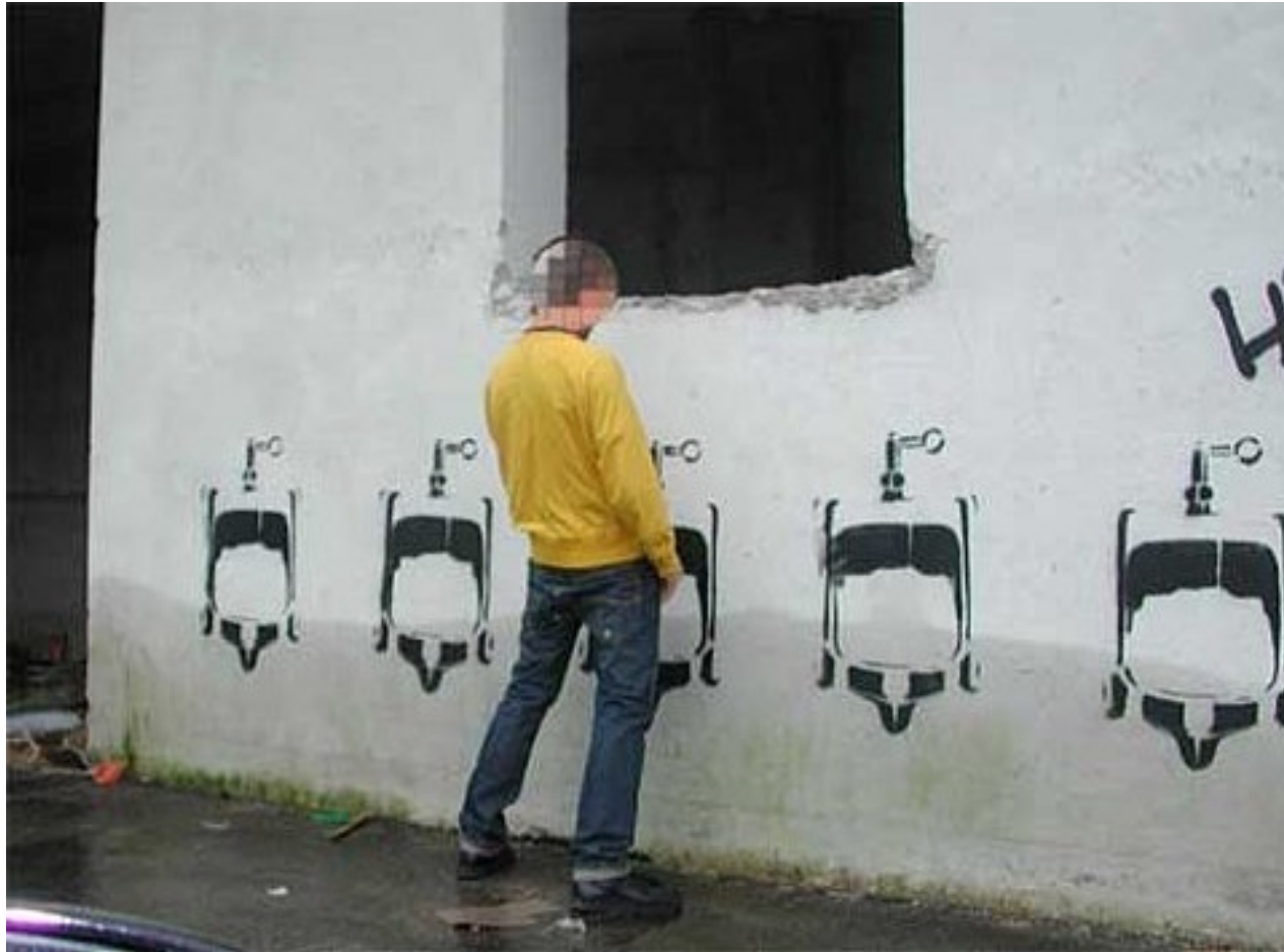
Wooster Collective: Stencils Archives