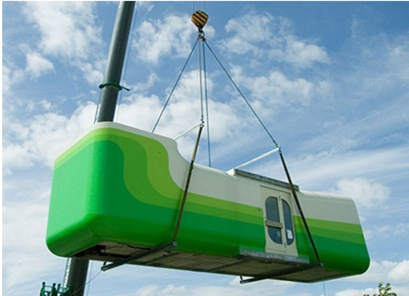
Hotel Everland (hotel)