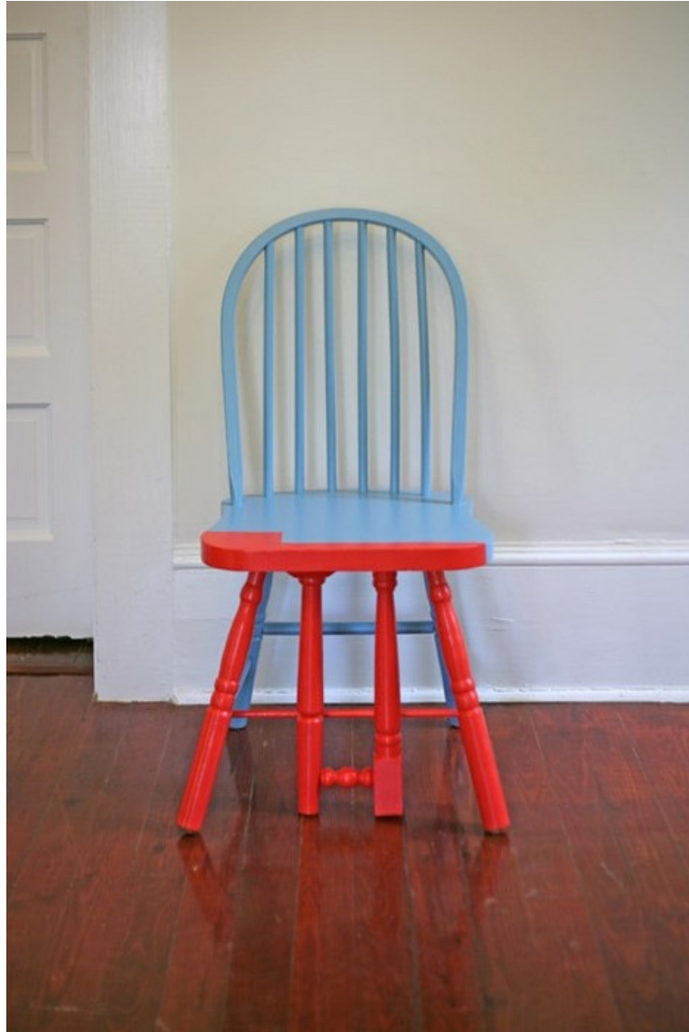
Rescued Chairs by Annie Coggan