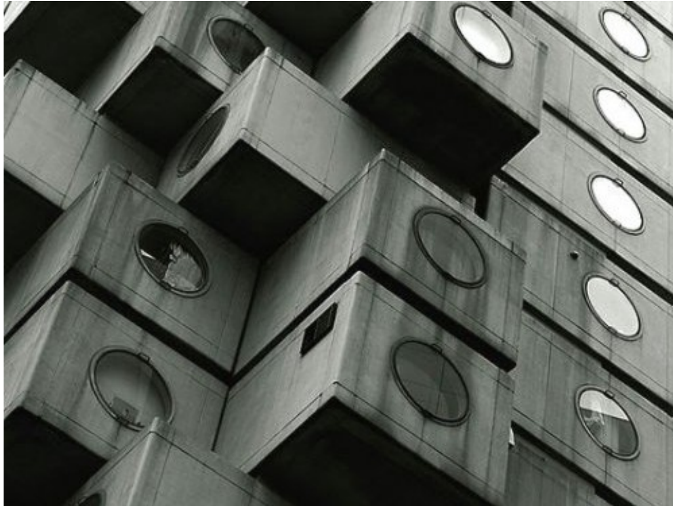
Nakagin Capsule Towers in Tokyo (hotel)